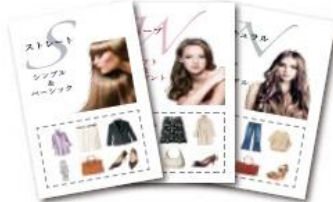
③アドバイシートのデータ付