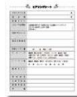
④ヒアリングシート